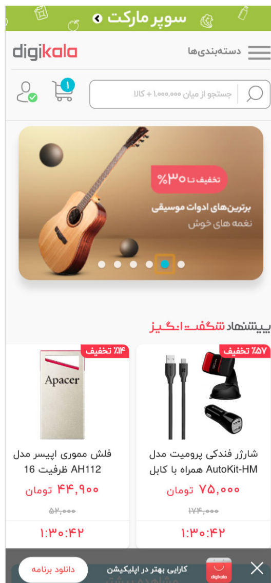
قالب سایت دیجی کالا برای موبایل

الان دیگه بیشتر مخاطبین سایت ها از طریق دستگاه تلفن همراه خود وارد سایت شما می شوند و این اهمیت باعث شد که گوگل از مسیر خزش خود را هم تغییر دهد و سایت هایی رو در اولویت قرار می دهد که نسخه موبایل خود را برای کاربرانشان آماده کرده اند.